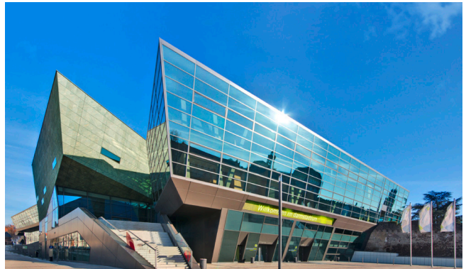
Residenzschloss Marktplatz 15 64283 Darmstadt