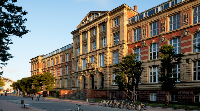
Altes Hauptgebäude S1|03 64289 Darmstadt